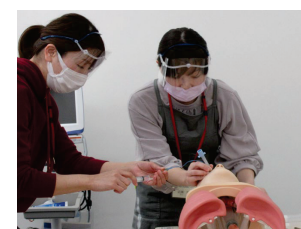
気管チューブの位置の調整