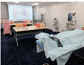
高機能シミュレーター