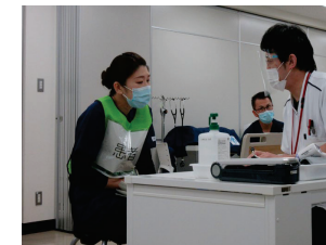
医療面接ロールプレイ